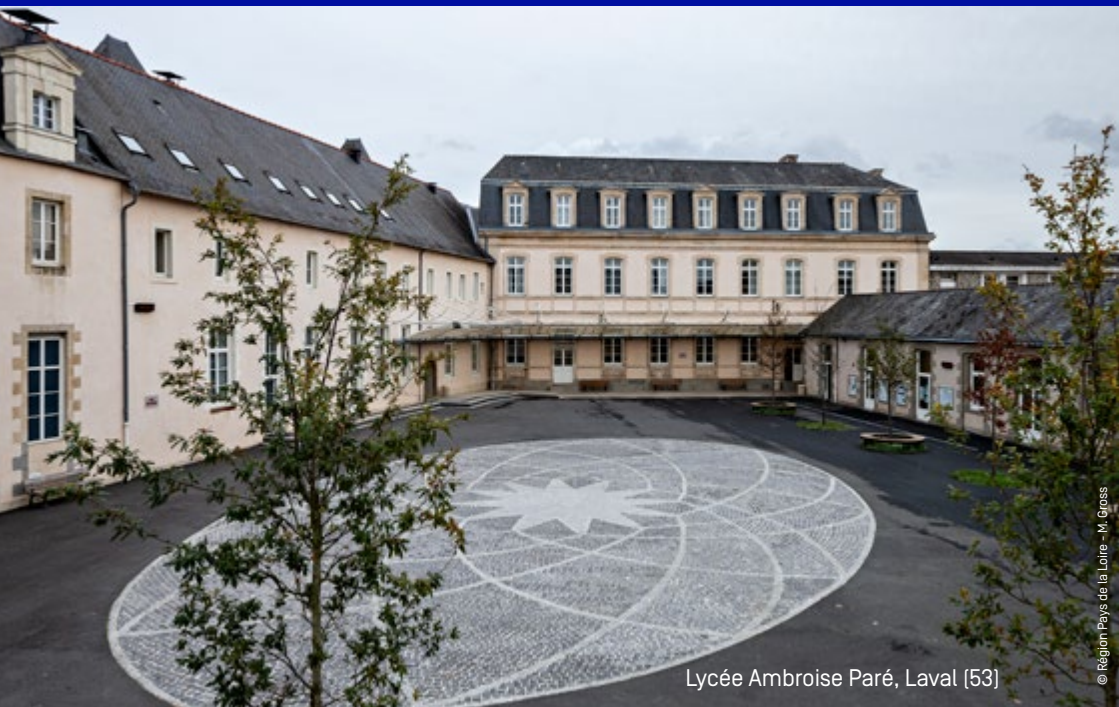
Lycée Ambroise Paré, Laval [53]