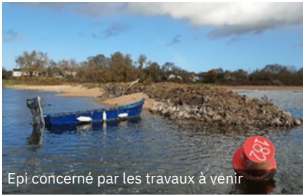
Epi concerné par les travaux à venir