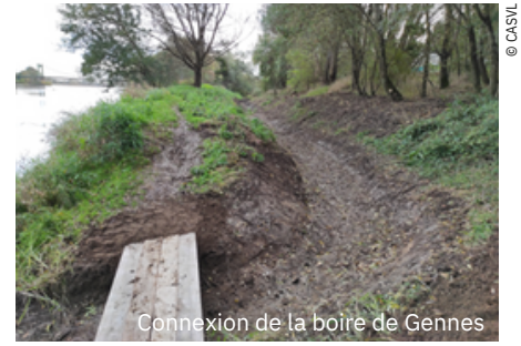
Connexion de la boire de Gennes

*Restauration du lit et Trajectoires Ecologiques, Morphologiques et d'USages en Basse Loire