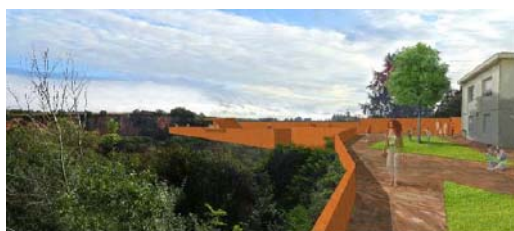
ESQUISSE DU PROJET DE BELVEDÈRE © EMMANUEL RITZ

Le site de Pont-Caffino est traversé par la Maine dans une vallée encaissée, bordée de falaises côté Château-Thébaud et côté Maisdon-sur-Sèvre. Cet espace accueille déjà toute l'année des activités sportives de plein air : escalade, canoë-kayak, tir à l'arc... Pour renforcer l'attractivité de ce site, la Communauté d'agglomération de Clisson Sèvre et Maine Agglo