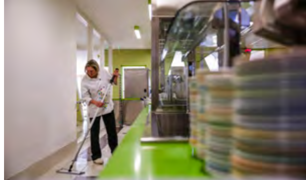
Les beaux matins