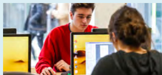
© Région Pays de la Loire / A. Monié - Les beaux matins

512 ordinateurs portables sous linux équipés des outils de développement Python ont été déployés au printemps 2019 dans les 32 lycées qui proposeront, à la rentrée 2019, la nouvelle section NSI, Numérique et sciences informatiques, créée dans le cadre de la réforme du baccalauréat (budget : 223 000 €). 500 000 € ont été votés, par ailleurs, au Budget secondaire en juin pour répondre aux autres besoins en équipements liés à la réforme du bac (enseignement du numérique pour tous les élèves de seconde par exemple).