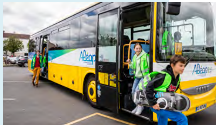
© Région Pays de la Loire / A. Monié - Les beaux matins

900 € COÛT D'UN ÉLÈVE transporté pour la collectivité soit 130 M€ /an