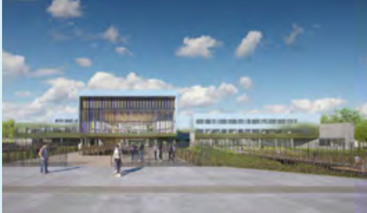
© Cabinet ARS Architectes Rocheteau Saillard

Pour répondre à la tension démographique des populations lycéennes en Loire-Atlantique et en Vendée, la Région a décidé la construction de six nouveaux lycées à Nort-sur-Erdre, Saint-Gilles-Croix-de-Vie, Aizenay, Pont-Château, Saint-Philbert de Grand Lieu et à Vertou. Ces nouveaux lycées polyvalents soulageront les lycées les plus en tension d'effectifs en Loire-Atlantique et en Vendée et accompagneront la poussée démographique des secteurs.