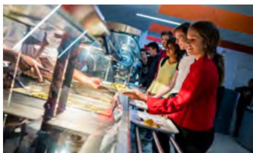
© Région Pays de la Loire / A. Monié - Les beaux matins

75 000 DEMI-PENSIONNAIRES 1 400 AGENTS RÉGIONAUX