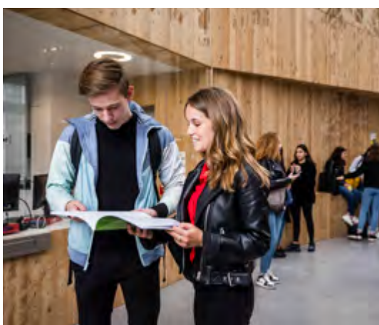
© Région des Pays de la Loire / A. Monié - Les beaux matins

Manuels scolaires, équipements professionnels, transports, loisirs : la rentrée est source de dépenses qui alourdissent le budget des familles. Pour permettre aux familles ligériennes de faire face à ces dépenses et garantir les meilleures conditions d'apprentissage aux lycéens et apprentis, la Région fait le choix d'alléger le budget rentrée avec des aides concrètes et complémentaires aux aides obligatoires.