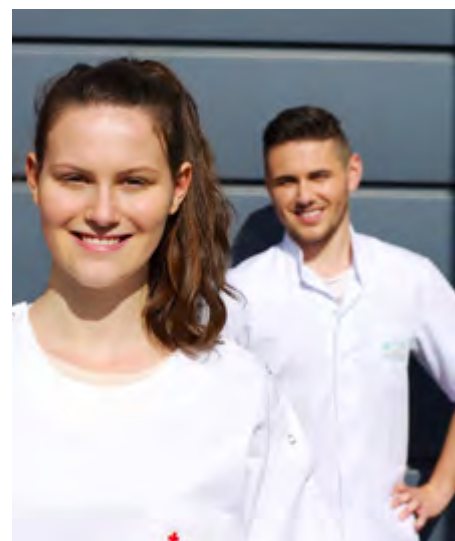
© Région des Pays de la Loire / J. Hermann - Les beaux matins

FINANCEMENT RÉGION 6M€+2M€ POUR RÉMUNÉRER les stagiaires